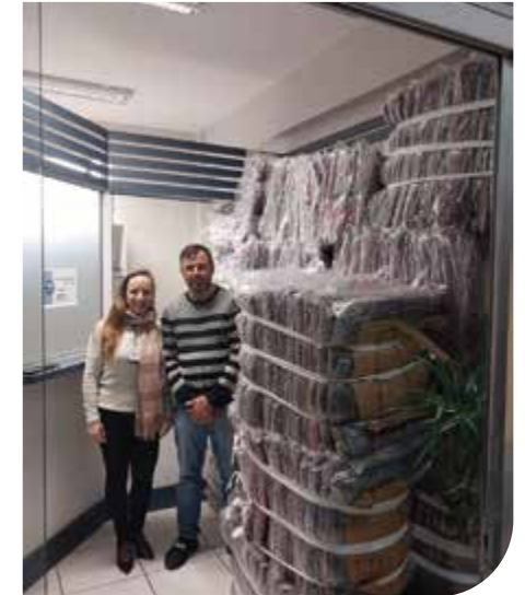
São Lourenço do Sul/RS