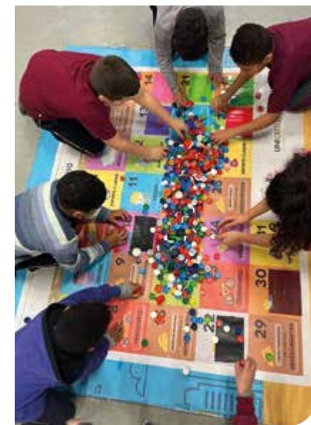
Caxias do Sul/RS