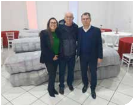
Cachoeira do Sul/RS