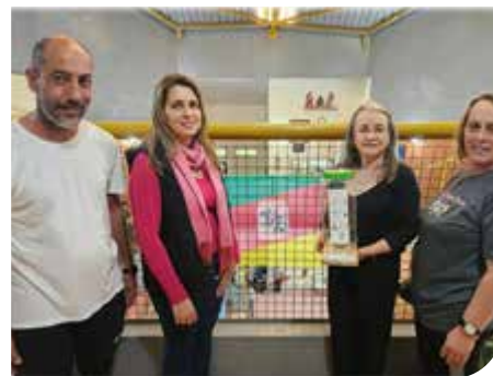
Caxias do Sul/RS

O Programa Vida Que Prospera lançou no mês de setembro a campanha de Logística Reversa para o descarte de materiais de escrita. O objetivo dessa ação é a conscientização para o consumo equilibrado e descarte correto dos resíduos sólidos, neste caso: canetas, lápis, apontadores e demais materiais de uso comum para os alunos. Através da prática da Logística Reversa, o material descartado é enviado à indústria, onde será transformado em utensílios como vasos, galões e bancos. Em contrapartida, a escola recebe em dinheiro, um valor equivalente a quantidade de resíduos enviados.