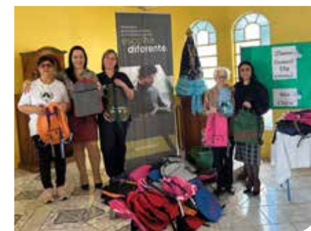
São Francisco de Paula/RS