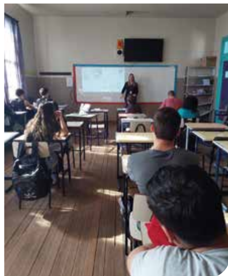
São Lourenço do Sul/RS