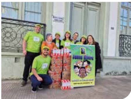
Santana do Livramento/RS

A Unicred Prosperar realizou no segundo final de semana de julho, a doação de 540 litros de leite para entidades em Sant'Ana do Livramento . Foram 360 litros para a Santa Casa de Misericórdia e 180 litros para a creche Santa Elvira. Todas as caixas de leite doadas para as instituições voltarão para a Unicred vazias e limpas, para que a Cooperativa repasse a Universidade Federal do Pampa (Unipampa), a qual desenvolve um projeto de revestimento de casas com as caixas de leite, com o objetivo de aquecer o ambiente no inverno e contemplar famílias em vulnerabilidade social.