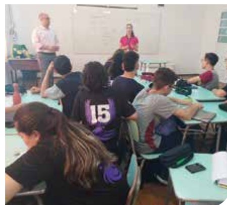
São Lourenço do Sul/RS

Dia 22 de outubro, o Vida Que Prospera esteve na Escola Cristo Rei, em Rio Grande, realizando com os alunos do nono ano a dinâmica do Orçamento e Planejamento Financeiro . Os alunos tiveram a oportunidade de refletir sobre a organização das demandas de consumo, enquadrando-as em despesas fixas, variadas e imprevistos, e conversar sobre hábitos e autoconhecimento.