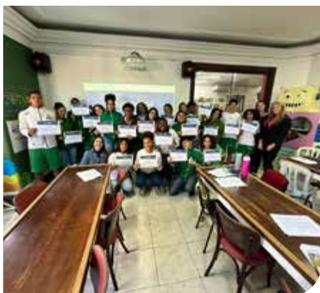
Rio de Janeiro/RJ

Ainda no mês de agosto, foi realizada ação presencial do Unipoupe na Instituição Solar Meninos da Luz, que atende alunos residentes das comunidades do Cantagalo, Pavão e Pavãozinho, no Rio de Janeiro/RJ . Na oportunidade foram abordados temas como: autoconhecimento, sonhos, objetivos , planejamento, organização, cuidados, e vários outros assuntos importantes para os jovens.