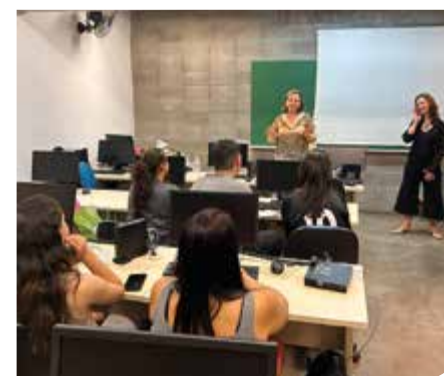
Caxias do Sul/RS

A partir da parceria estabelecida Na noite de 11 de setembro, o Vida Que prospera esteve com nove jovens do Projeto Ser Mais, em Caxias do Sul/RS. Foi realizada uma oficina de finanças pessoais no formato de jogo. A atividade foi dinâmica e os jovens participaram ativamente da proposta que simula a organização de um orçamento para planejamento financeiro.