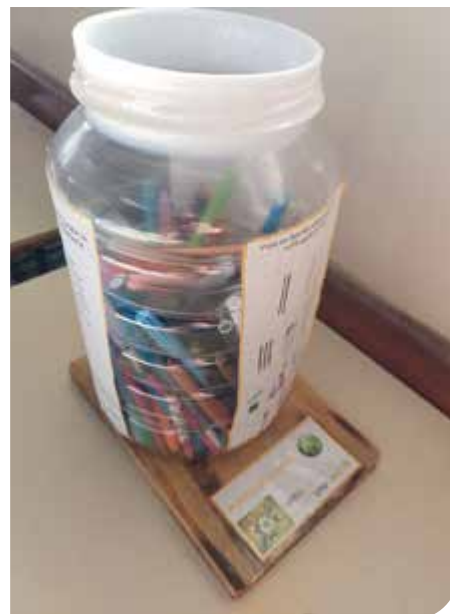
Caxias do Sul/RS

Mais de cem alunos da E.M.E.F. Erny de Zorzi participaram de atividades de Educação financeira do Programa Vida Que Prospera . Os alunos aprenderam sobre a História do Dinheiro, discutindo hábitos de consumo, métodos de pagamento e os riscos associados a apostas como o “jogo do tigrinho”; trabalharam com orçamento e planejamento, simulando a gestão do salário de um jovem aprendiz; e participaram da vivência do Jogo do Desafio. A escola também implementou a Logística Reversa por meio do Programa, instalando coletores de materiais de escrita em todas as salas. A iniciativa visa reciclar estes materiais para produção de novos itens, contribuindo com a preservação ambiental .