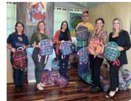
Caxias do Sul/RS

Unicred Integração entrega 200 mochilas do Projeto Casulo RS ao Centro de Atenção à Criança e ao Adolescente Murialdo, em Caxias do Sul/RS, uma Instituição que atende crianças e adolescentes entre 06 e 15 anos, em situação de vulnerabilidade e risco social.