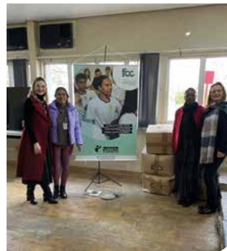
Canoas/RS, Guaíba/RS e Porto Alegre/RS

Ao longo de agosto e setembro, a Unicred Porto Alegre destinou 1.100 mochilas , obtidas por meio do Projeto Casulo RS , a entidades sociais das regiões afetadas pela enchente de maio no RS. A Escola São Mateus e Lar São José, localizados em Canoas, a Fundação Projeto Pescar, localizada em Porto Alegre, e a Guahyba Associação de Canoagem, com localização em Guaíba, foram as instituições beneficiadas com a ação.