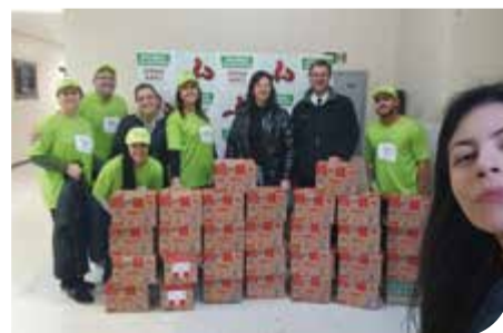
Santana do Livramento/RS