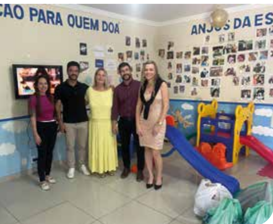
Rio de Janeiro/RJ

Agências Barra da Tijuca, Copacabana, Nova Iguaçu, Petrópolis, Teresópolis e Tijuca se uniram para arrecadar brinquedos para ajudar no Natal do Centro Cultural Cecília Conde . Entidade que assiste crianças carentes na cidade do Rio de Janeiro e que, todos os anos faz um Natal solidário com entrega de presentes, cestas básicas e claro, a presença do Papai Noel .