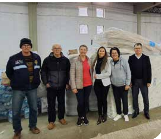
Cachoeira do Sul/RS