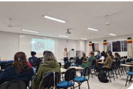
Caxias do Sul/RS

O projeto, viabilizado pelo Instituto Unicred, propõe atividades em grupo para que os alunos reflitam sobre a convivência escolar, identificando aspectos que podem ser melhorados em benefício de todos a partir dos princípios do cooperativismo .