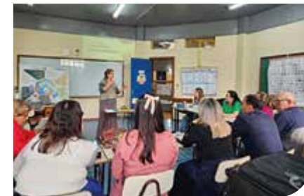
Caxias do Sul/RS

A partir da parceria estabelecida com a Secretaria Municipal de Educação de Caxias do Sul/RS, várias escolas solicitaram a “ Oficina de Educação financeira para Professores ”, atividade que integra o Programa Vida Que Prospera . Em uma das oportunidades, foi realizada uma conversa com os docentes sobre aspectos comportamentais que impactam diretamente na relação das pessoas com o dinheiro.